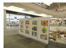
イオンモールでのポスター展