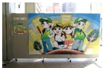
県庁本館 1 階ロビーでの展示状況

また、県内選考会で入選した防犯ポスター12点を、10月10日から10月27日 まで県庁本館1階ロビー及びイオンモール高松店に展示した。