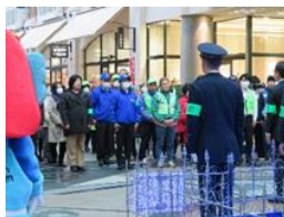
丸亀町商店街3町ドームでの特殊詐欺防止キャンペーン

12月14日、高松市丸亀町商店街において特殊詐欺被害防止キャンペーンを実施したほか、12月18日、高松市南新町商店街において買い物客等を対象に自転車盗難防止キャンペーンを行い、啓発チラシや防犯グッズ等を配布して防犯意識の高揚に努めた。