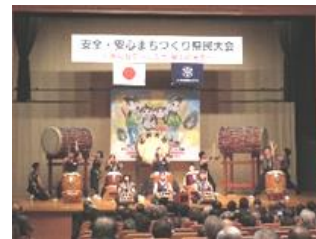
農経高校拓心太鼓部の和太鼓演舞