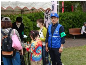
仏生山公園での防犯フェア

10月14日、高松市仏生山公園の秋祭りで、警察、大学生ボランティアサークルなどと連携して住宅対象侵入盗等被害防止を目的とした「地域安全フェア」を開催したほか、10月17日には香川大学教育学部幸町キャンパス内で、警察、少年警察補導員、香川大学防犯パトロール隊と連携し、自転車の施錠率調査と学生を対象にワイヤー錠や啓発チラシを配布して侵入盗・自転車盗の被害防止に努めた。