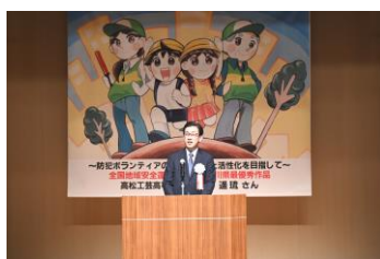
吉田副会長（警察本部長）挨拶

(2) 10月13日、県社会福祉総合センターにおいて、本会副会長吉田警察本部長出席のもと「安全・安心まちづくり県民大会」を開催し、全国防犯栄誉金章、銀章、銅章、防犯功労団体、管区防犯功労者、功労団体、防犯ポスター最優秀受賞者に対する表彰式を行った。