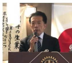
ロータリークラブでの説明