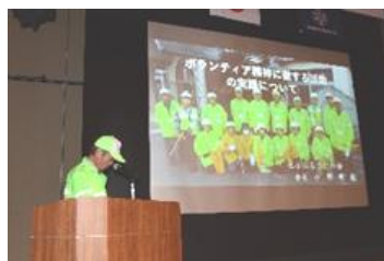
防犯ボランティア活動実践発表