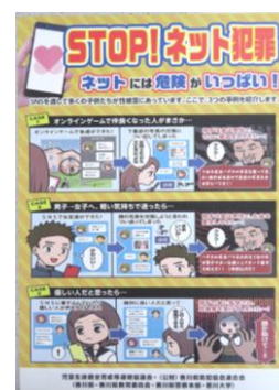
広報資料「STOP！ネット犯罪」