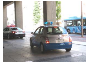
「安全・安心まちづくり旬間」・「全国地域安全運動」パトロール出発式