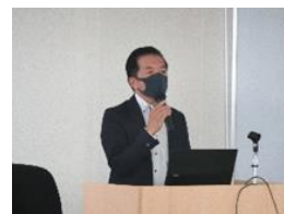
JU 香川での防犯講話