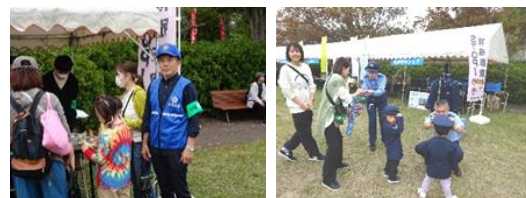
仏生山公園での地域安全フェア

10月14日、高松市仏生山公園での秋祭りにおいて、警察や大学生ボランティアグループ、防犯関係団体と連携し、特殊詐欺・自転車盗・住宅対象侵入盗の被害防止を目的とした「地域安全フェア」を開催した。