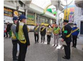
高松南新町商店街での自転車盗防止キャンペーン