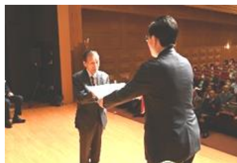
防犯功労者等表彰式