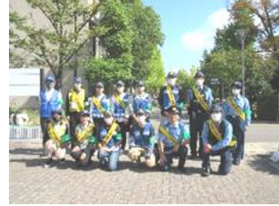
香川大学構内での自転車施錠率調査と防犯キャンペーン