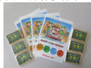
防犯標語入りクリアファイル・ポケットティッシュ

上記の資料、グッズを作成して関係機関・団体等への配付や各種会合あるいは街頭防犯キャンペーン等で配付し、身近な犯罪被害の防止に努めた。