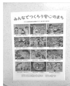
防犯標語入りクリアファイル

上記の資料、グッズを作成して関係機関・団体等への配付や各種会合あるいは街頭防犯キャンペーン等で配付し、身近な犯罪被害の防止に努めた。