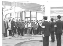
丸亀町商店街3町ドーム