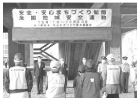
安全・安心パトロール出発式

10月7日に「安全安心まちづくり旬間」「全国地域安全運動」の一環として、県くらし安全安心課と協働して「パトロール出発式」、12月9日には、県警察本部の「年末年始の特別警戒出発式」に参加した。