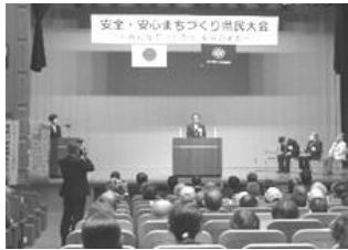
池田会長（県知事）挨拶

(2) 10月14日、県社会福祉総合センターにおいて、本会会長池田県知事、本会副会長今井警察本部長出席のもと「安全・安心まちづくり県民大会」を開催し、全国防犯栄誉金章、銀章、銅章、防犯功労団体、管区防犯功労者、功労団体、防犯ポスター最優秀受賞者に対する表彰式を行った。