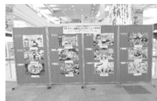
イオンモール高松店での展示状況