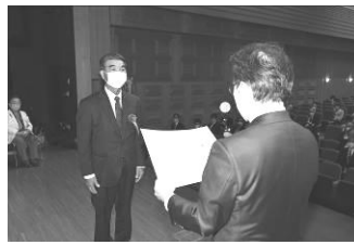
防犯功労者等表彰式