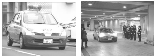
青色防犯パトカーによるパトロール活動