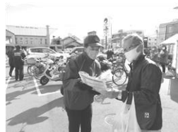
マルナカ木太町店