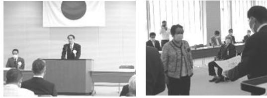
防犯功労者等表彰式

副会長今井警察本部長出席のもと、表彰式を開催し、防犯功労者17名、防犯功労団体6団体を表彰した。