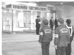
年末年始の特別警戒出発式