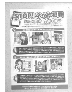
広報資料「STOP！ネット犯罪」