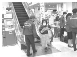
イオンモール高松店

10月20日イオンモール高松店、12月15日高松市丸亀町商店街において特殊詐欺被害防止キャンペーンを実施したほか、12月16日マルナカ木太町店において買い物客を対象に万引き防止・特殊詐欺被害防止キャンペーンを行い、啓発チラシや防犯グッズ等を配布して防犯意識の高揚に努めた。