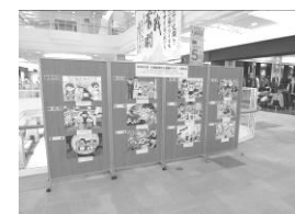
イオンモールでのポスター展