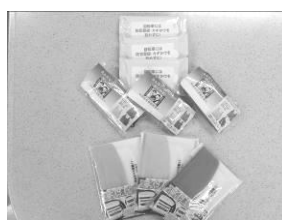
エコバッグ・通帳ホルダー等