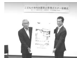
防犯ポスター寄贈式