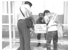
香川大学構内での自転車施錠率調査とキャンペーン