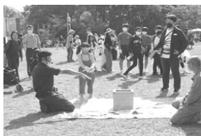
仏生山公園での防犯ガラス体験

10月16日、高松市仏生山公園の秋祭りで、警察、大学生ボランティアサークルなどと連携して住宅対象侵入盗等被害防止を目的とした「地域安全フェア」を開催したほか、10月17日には香川大学教育学部幸町キャンパス内で、警察、少年警察補導員、香川大学防犯パトロール隊と連携し、自転車の施錠率調査と学生を対象にワイヤー錠や啓発チラシを配布して侵入盗・自転車盗の被害防止に努めた。