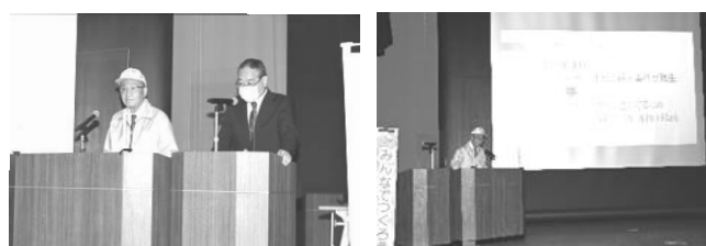
防犯ボランティア活動実践発表