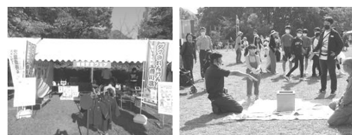
仏生山公園での地域安全フェア

10月16日、高松市仏生山公園での秋祭りにおいて、警察や大学生ボランティアグループ、防犯関係団体と連携し、特殊詐欺・自転車盗・住宅対象侵入盗の被害防止を