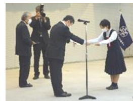
防犯功労者等表彰式