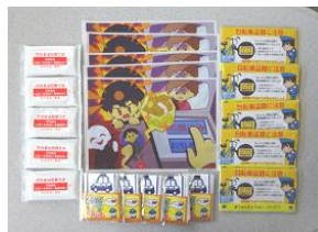
マスク・レジ袋等