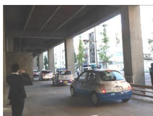
安全・安心パトロール出発式

10月8日に「安全安心まちづくり旬間」「全国地域安全運動」の一環として、県くらし安全安心課と共同して「パトロール出発式」、12月10日には、県警察本部の「年末警戒出発式」に参加した。